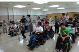
ボッチャの表彰式