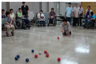
レクリエーション大会の風景より

当日は三十五名の卒業生と旧職員が参加し、チーム戦で「ポッチャ」を楽しみました。昼食を食べながらの懇談でも会話が弾み、和やかなひと時を過ごすことができました。