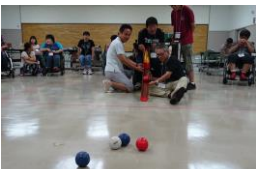
ボッチャの試合風景